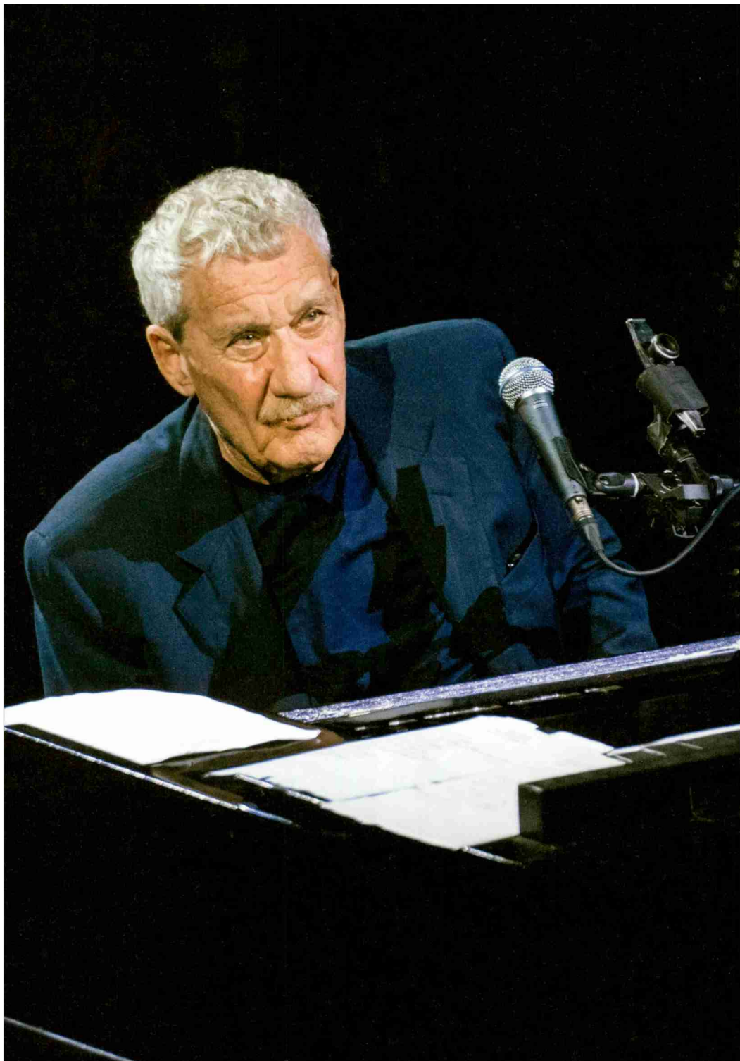
← Paolo Conte als Highlight des Jazzfestivals in St.Moritz.

Referenz: 66982761 Ausschnitt Seite: 1/9