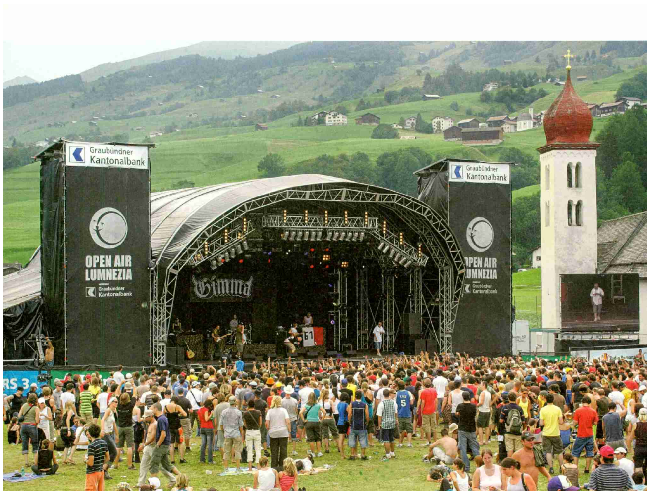
↑ Seit über 20 Jahren ein Grossereignis: Open Air Val Lumnezia.

Referenz: 66982761 Ausschnitt Seite: 7/9