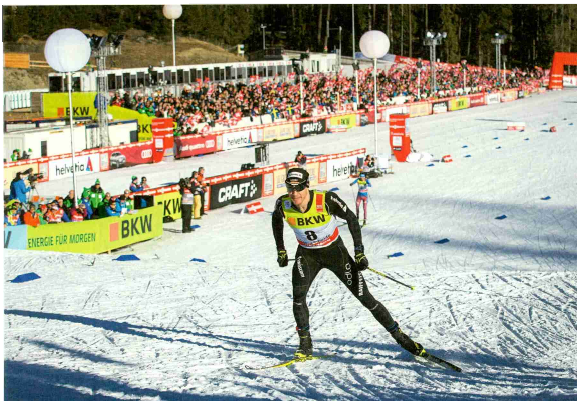
← Ein Monster- event: die «Tour de Ski» in Lenzerheide.

Referenz: 66982761 Ausschnitt Seite: 6/9