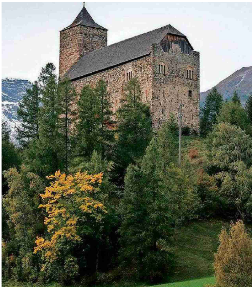
In der Burg von Riom ist ein Theatersaal untergebracht.