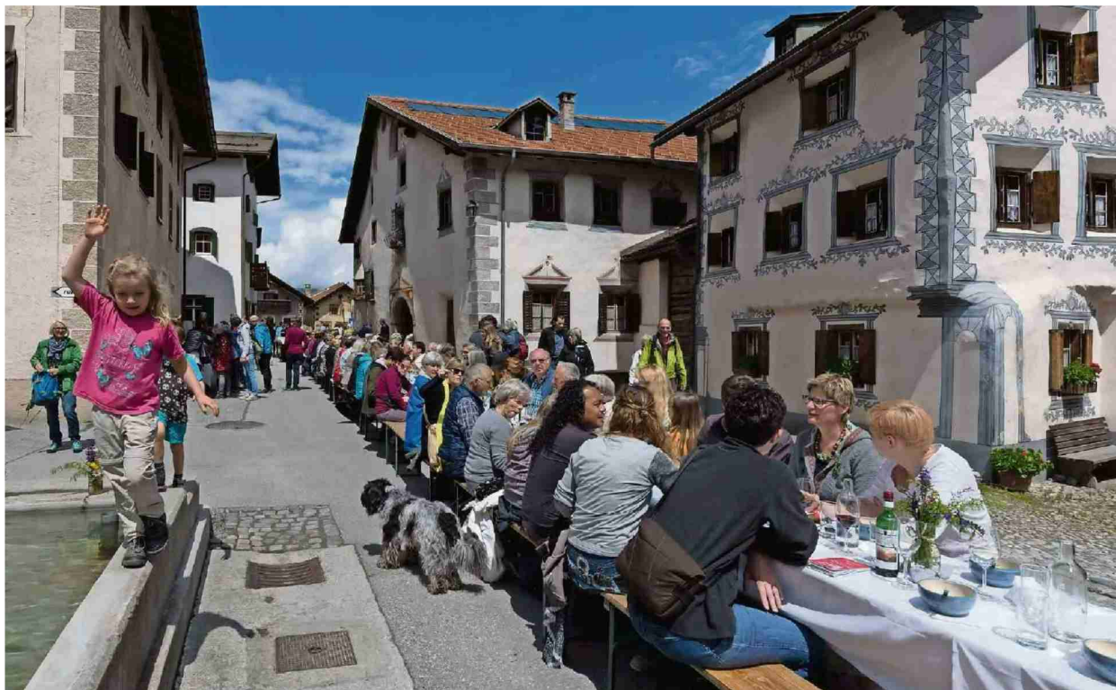
Alle an einem Tisch: Die «Mega lungia» auf dem Dorfplatz von Berggün bringt an diesem Wochenende Gross und Klein, Einheimische, Besucher und Künstler zusammen.