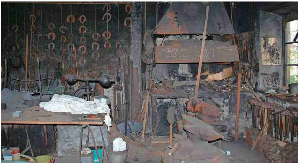
Die alte Hufschmiede des Posthotels «Löwen» erinnert an eine vergangene Epoche.