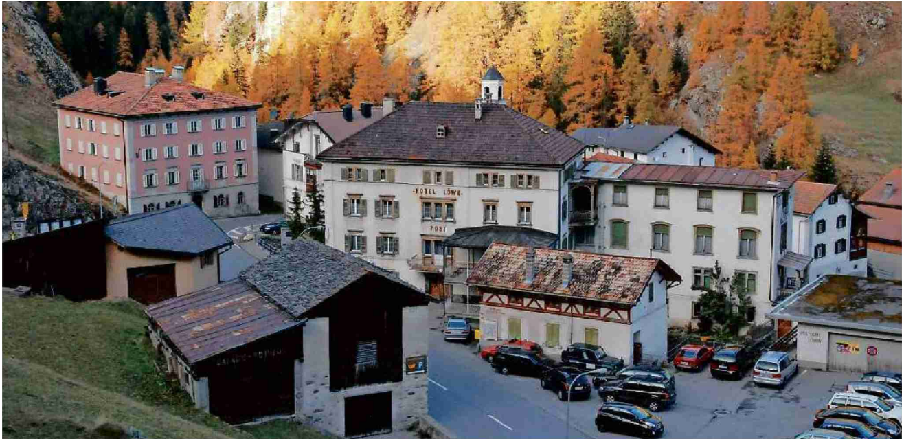
Das überschaubare Bergdorf Mulegns liegt an der Strasse zum Julierpass.

Referenz: 70452352 Ausschnitt Seite: 2/5