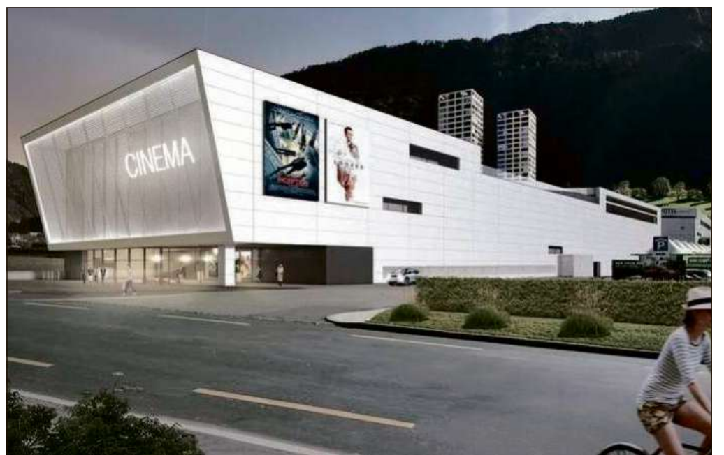
Visualisaziun dal complex da kino a Cuir.

* Laudatio a caschun dall'attribuziun dil Premi Wakker alla Nova Fundaziun Origen.