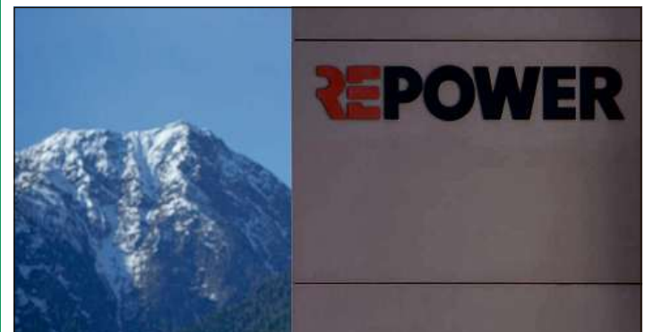
La sedia principala da Repower è a Poschivo.

verola crudada ora per pli ditg e quai haja gi in'influenza negativa sin il resultat. Repower quinta che las marschas en la branscha d'energia sajan vinavant sut squitsch. L'interpresa haja dentant ina basa da chapital solida per pudair resistester.