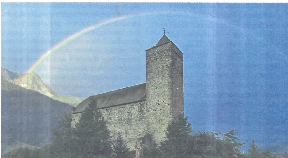
Chesta stad davainta igl casti da Riom ena tgesa da ballet.

chegl tgi pertotga la logistica fissigl davanto ena veira sfida cun aveir da manar igls visitaders dallas producziuns cun autos da posta sen Gelgia. Er an chella tgossa fiss betg sto pussebel da sa tigneir allas distanzas perscretgas. Igl intendant d'Origen ò er detg tgi bliers visitaders digl festival totgan tar la gruppa da risc, uscheia tgi seia en'obligaziun da suandar allas directivas. Visitaders scu er tot las otras persungas involucadas aint igl program seia da schurmager. «Ia sa daveiras betg deir schi igl public vign ansomma an en schi grond domber scu igls davos onns».