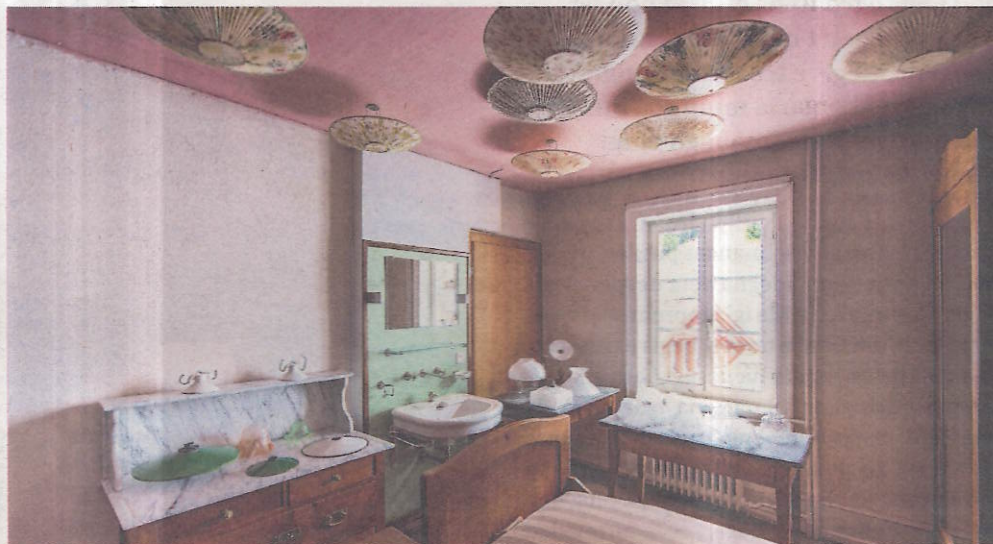
En tgit ainten la tgombra noua tgi las bleras lampas èn exponeidas.