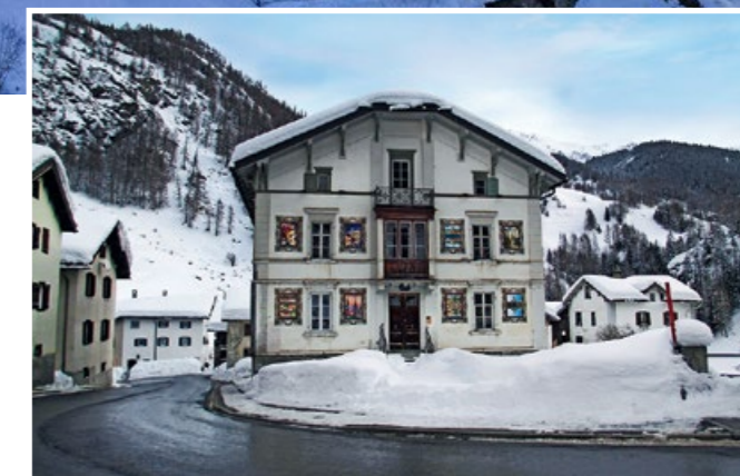
Die «Weisse Villa», eine ehemalige Zuckerbäckerei, wurde im Sommer acht Meter talwärts verschoben.