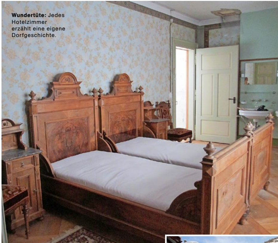
Wundertüte: Jedes Hotelzimmer erzählt eine eigene Dorfgeschichte.