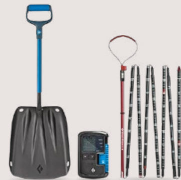
Das «Black Diamond Guide BT Avy Safety Set» kostet Fr. 600.– ( black-diamondequipment.com/de_CH ).

Denken Sie jetzt nicht, dieses Thema geht nur Freerider und Skitourenfahrer etwas an: Immer mehr Schneeschuh-Tourenguides sind mit ihren Gästen mit einem LVS-Set unterwegs. Ich persönlich setze auf eines von Black Diamond : Die «Evac Schaufel» und die «Quickdraw Carbon 320 Sonde» helfen mir im Ernstfall bei der effizienten Suche und Schneeanalyse. Und der «Guide BT Beacon» , also das LVS, ist so einfach in der Bedienung, dass man es auch mit zitternden Fingern und erhöhtem Puls schaffen würde. Mit einer Empfangsreichweite von 60 Metern deckt es zudem ein grosses Gebiet ab. Erschrecken Sie nicht, wenn Sie den Preis des «BD Guide BT Avy Safety Set» lesen: Lawinenschutz ist nicht billig, es kann aber Leben retten. Sonja Hüslér