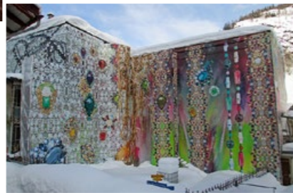
Bei der Sanierung der Fassade wurde das Hotel originell eingepackt.