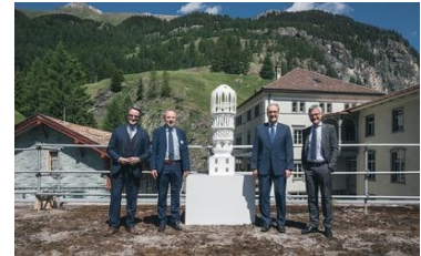
Ein Turm aus dem 3D-Drucker für Mulegns