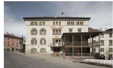
Hotel Löwen in Mulegns erhält Kantonsfelder